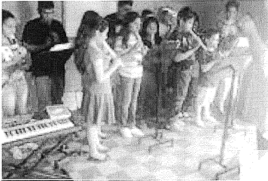
ACTIVIDAD DESARROLLADA Ligadura. realizada el día 13 de Octubre de 2017.