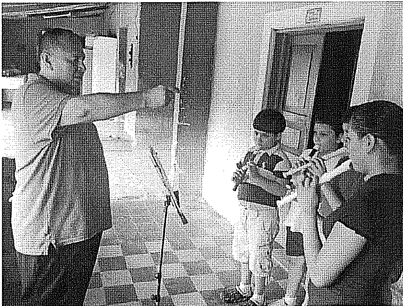
ACTIVIDAD DESARROLLADA Notas tenidas. realizada el día 23 de Octubre de 2017.