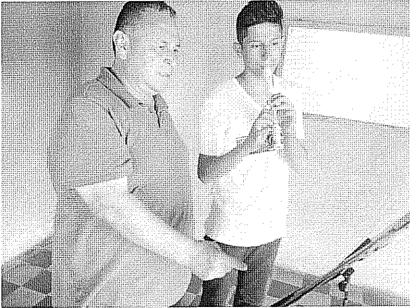
ACTIVIDAD DESARROLLADA Escala Cromatica. realizada el dia 30 de Octubre de 2017.